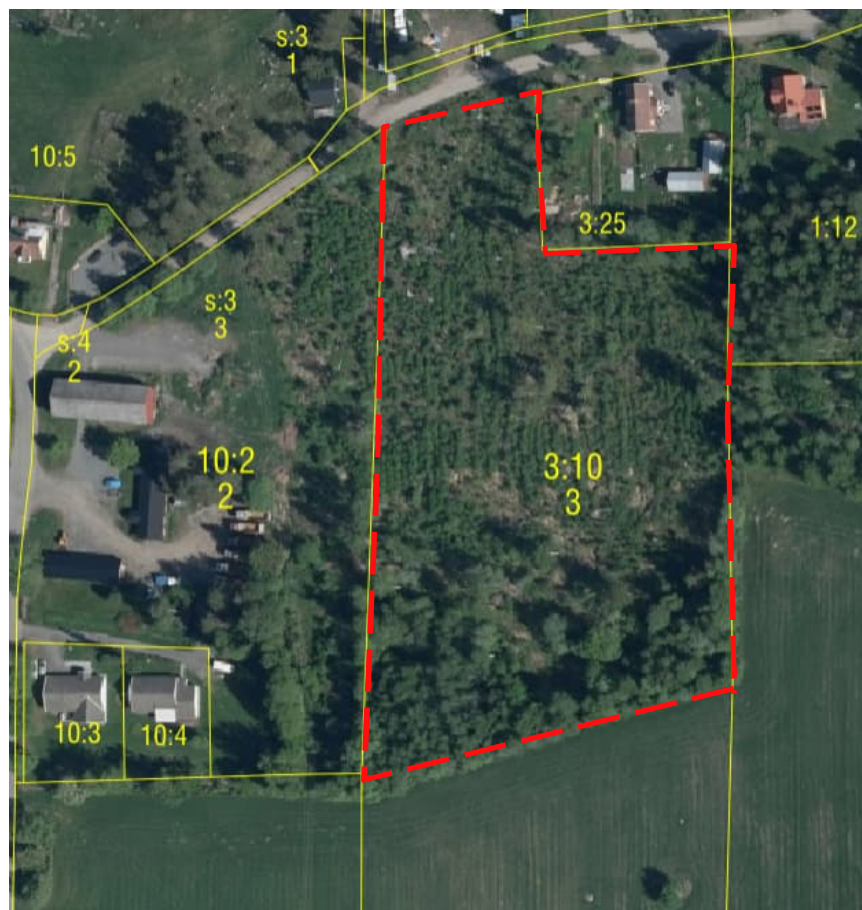
Ortofoto med fastighetsbild, planområdet markeras ungefärligt med rött (källa underlagskarta: Lantmäteriet 2022-10-03).