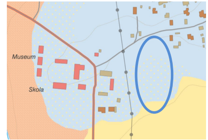
Markbeskaffenhets. I blått markeras planområdet.